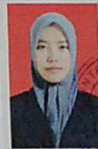
Tanda Tangan Pencari Kerja

No. Induk Kependudukan 3 2 0 1 1 3 6 3 1 0 9 4 0 0 0 3