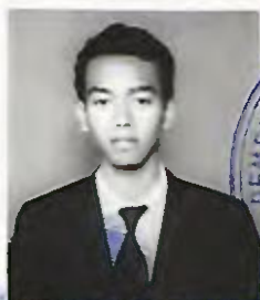
SMK NEGERI 1 JAKARTA