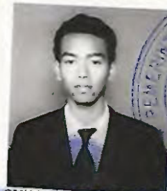
SMK NEGERI 1 JAKARTA

dari satuan pendidikan berdasarkan hasil Ujian Nasional dan Ujian Sekolah serta telah memenuhi seluruh kriteria sesuai dengan peraturan perundang-undangan.