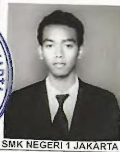
SMK NEGERI 1 JAKARTA